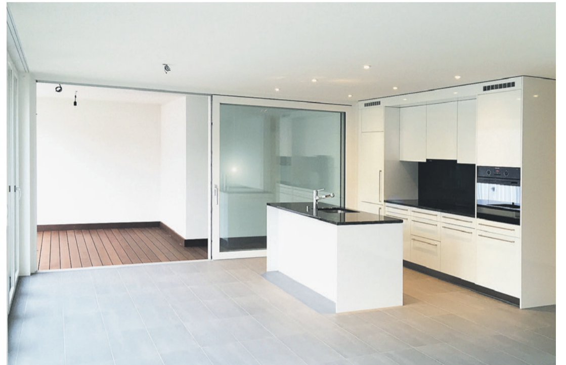
Die Mangold Architekten AG hat in Thürnen in zwei gleichartigen Gebäuden Wohnungen geschaffen, die behagliches Wohnen in modernem Ambiente bieten.