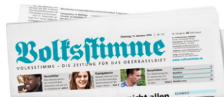
Die Zeitung für das Oberbaselbiet.

Als amtliches Organ erreicht die «Volksstimme» mit 20 Grossauflagen sämtliche Haushaltungen in 50 Gemeinden.