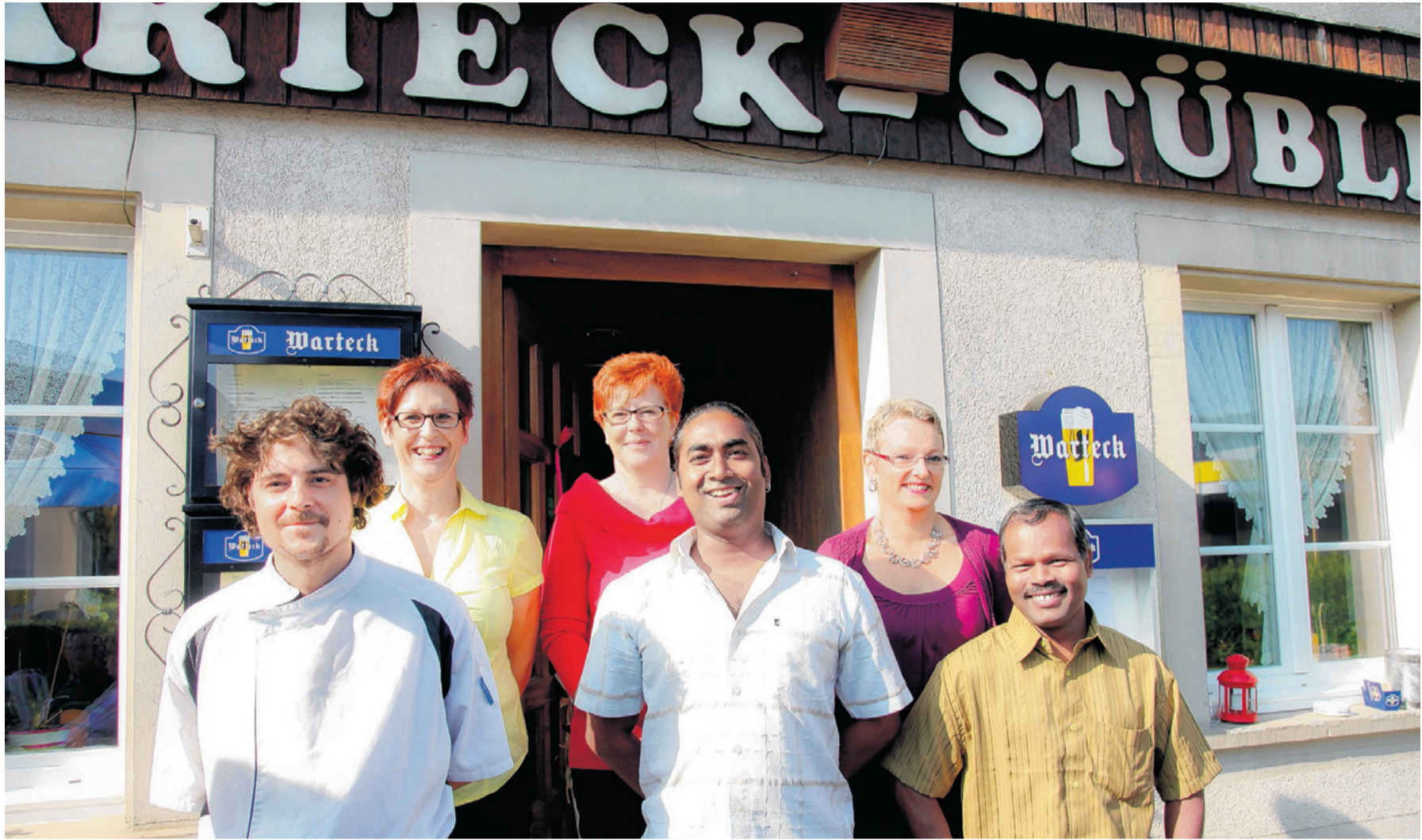
Das Warteck-Team feiert das Zehn-Jahr-Jubiläum und freut sich auf Ihren Besuch.